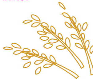
Muiléad (cineál gráin as a ndéantar plúr)