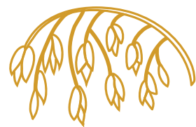
Sorgam (cineál gráin as a ndéantar leite)