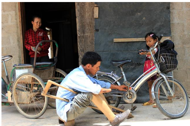
Than ag glanadh rothar a iníne

Bíonn a bhean ag tabhairt aire do mhuca agus do chearca sa bhaile agus bíonn Than i bhfeighil na dtrí bhó - a shaolaigh an chéad bhó a thug Tionscadal RENEW dóibh in 2008. Saothraíonn an lánúin gort beag fosta ina bhfásann go leor ríse chun an teaghlach a chothú.